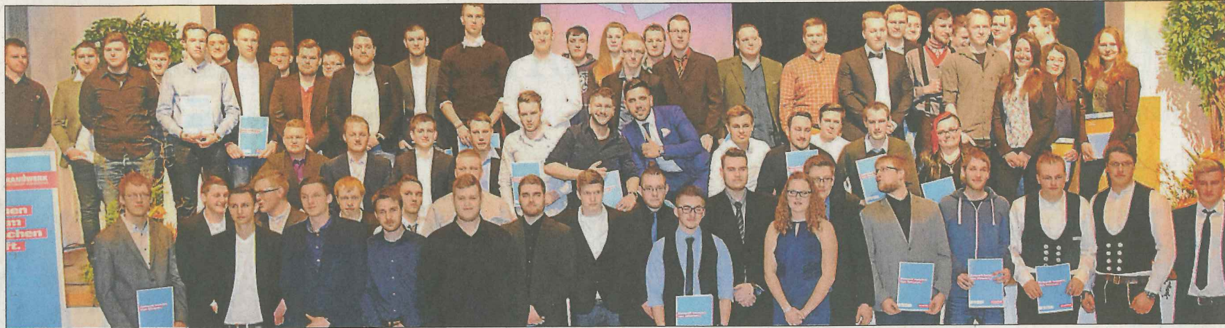
Erinnerungsfoto auf der Friedeburg-Bühne: Die Handwerksgelesen feierten in der Nordenhamer Stadthalle das Ende ihrer Ausbildungszeit.

HANDWERK 77 Berufsanfänger bekommen bei Freisprechungsfeier ihre Gesellenbriefe überreicht