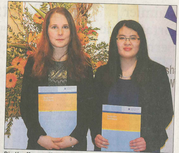
Die Kauffrauen für Büromanagement