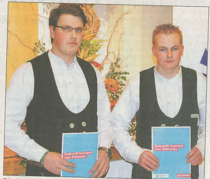
Die Zimmerer, Ausbaufacharbeiter/Dachdecker

Winkler GmbH & Co. KG, Bremen / Norddeutsche Holzwerkstoffe AG, Bremen